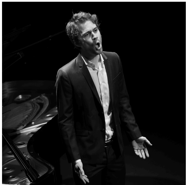
Illustrato: ©M. Fayette